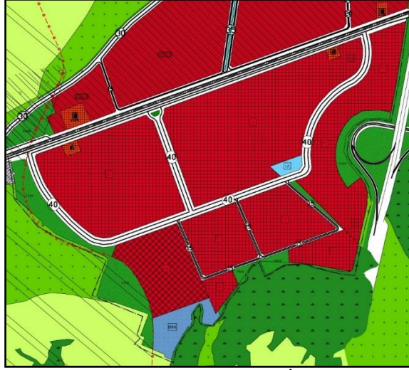
Onaylı 1/5000 ölçekli Nazım İmar Planı

Bursa 4. İdare Mahkemesi'nin 2019/129 E. 2020/1120 K. sayılı kararı ile iptal edilen plan değişikliğine ilişkin, mahkeme kararı doğrultusunda plan değişikliği hazırlanmıştır. Bursa Büyükşehir Belediye Meclisi'nin 20.04.2021 tarih ve 640 sayılı kararı ile "Ticaret Alanı", "Toplu İşyeri Alanı" "Akaryakıt ve Servis İstasyonu Alanı", "İbadet Alanı", "Belediye Hizmet Alanı", "Park Alanı", "Yol Alanı" olarak belirlenmesine ilişkin 1/5000 ölçekli Akçalar Nazım İmar Planı değişikliği onaylanmıştır.