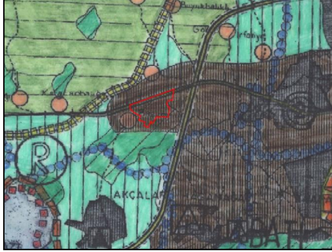
1/100 000 ölçekli Bursa Çevre Düzeni Planı

Plan değişikliğine konu alan, Bursa 2020 yılı 1/100.000 Ölçekli Çevre Düzeni Planında “Batı Planlama Bölgesi” sınırlarında kalmakta olup plan kararlarında “Kentsel Gelişmenin Yönlendirilebileceği Alanlar” olarak gösterilmektedir.